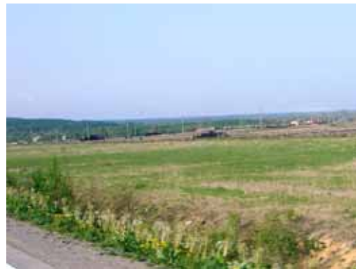
(2007 年 6 月撮影)

二の沢あたりから望む干潟には相変わらず座礁した廃船がある。コルサコフを抜け、プリゴノドノエまでの道は未舗装であるが、改良が進んで幅も十分に取っている。