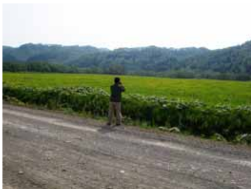
ロシアの自然に感動する湯野