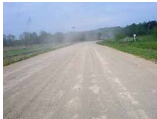
ほこり舞う砂利道