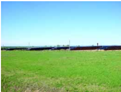
(2005 年 6 月撮影)